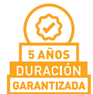
LÁMINA TRASLÚCIDA PARA USO RESIDENCIAL